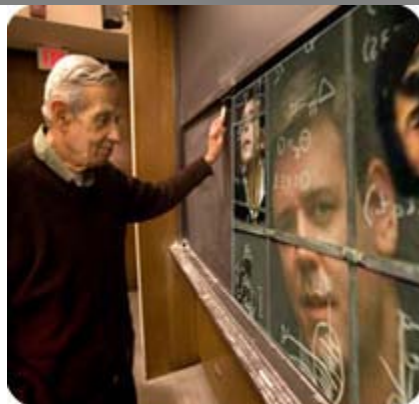
John Forbes Nash, Matemático y Premio Nobel de Economía Film: 'Una mente brillante'